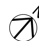
01 PLANTA DE SITUAÇÃO ESCALA: 1/1.000

DADOS: TERRENO URBANO (PARTE DA CHÁCARA Nº 01) DIMENSÕES: 60,00m x 100,00m ÁREA TOTAL: 6.000,00m² PROPRIETÁRIO: MUNICÍPIO DE MAREMA-SC MATRÍCULA Nº 18.410 ÁREA DA EDIFICAÇÃO: 1.228,08m²